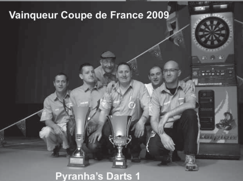
Vainqueur Coupe de France 2009