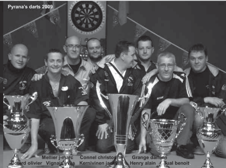
Pyranha's darts 2009