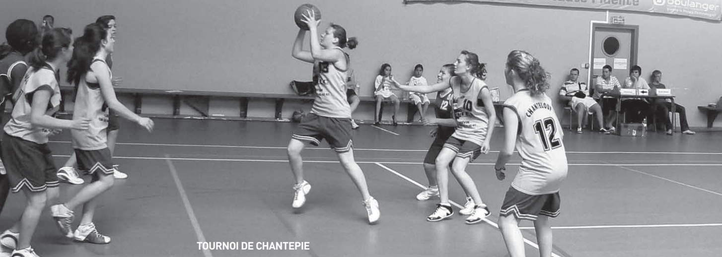
TOURNOI DE CHANTEPIE

Nous souhaitons à tous de très bonnes vacances d'été