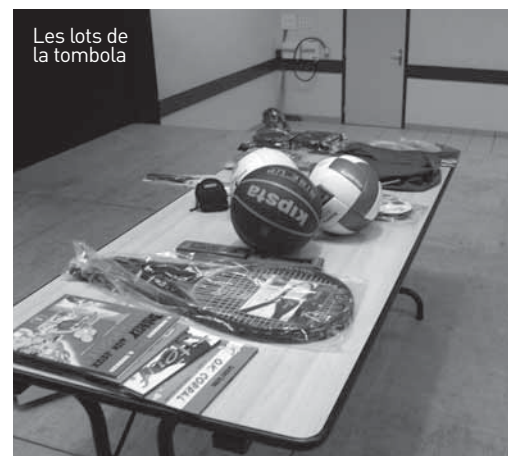
Les lots de la tombola